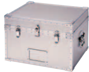
STシリーズ アルミ合金製 内装なし