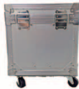
キャスター付 (特注)