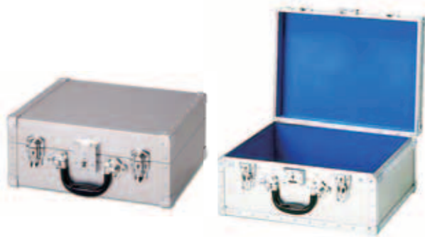
CTシリーズ STシリーズに内装がついたトランク、封印錠前付