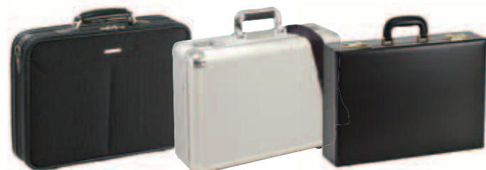
ソフトアタッシュケース アルミアタッシュケース ハードアタッシュケース