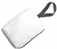
右ポケットポケットプル仕様 (インサイドストラップ付き)