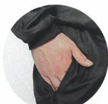
ファスナー付き ポケット(左右)