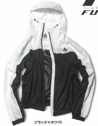
ブラック×ホワイト