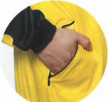
ファスナー付き ポケット(左右)